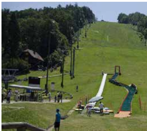
Radvanjčane zanima, kaj natančno naj bi poimenovali "Pohorje" v nazivu Zavoda za turizem Maribor - Pohorje, ki je očitno svoje mesto našlo le v imenu pristojne organizacije, ne pa v načrtih.

Na prvem jesenskem zboru SČS Tabor so udeleženci sooblikovali precej dolg dnevni red, kar samo kaže na dejstvo, koliko je stvari v lokalni skupnosti, za katere krajan menijo, da bi jih bilo treba urediti ali spremeniti. Zaslugo za to, da so kljub vsemu uspeli predelati vse predlagane točke nedvomno tiči v dejstvu, da krajan na zboru SČS Tabor med sabo komunicirajo brez zadržkov, vedno s kančkom humorja, pripravljeni pa so pomagati tudi pri reševanju težav, ki se jih