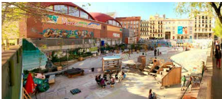
V Madridu je na lokaciji zapuščenega javnega bazenskega kompleksa nastalo interaktivno prizorišče za druženje, razpravo in kreativne izbruhe vseh vrst.

Začasna raba se zatorej pojavi kot vmesno stanje, dokler se ne vzpostavi predvidena nova raba, in je praviloma časovno omejena. Primeri