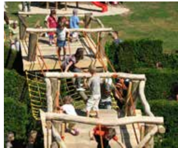
Bo tako kdaj tudi na Studencih?

Naslednji zbor bo v sredo, 30. 9. 2015, ob 18:15 v prostorih MČ Studenci na Erjavčevi 43.