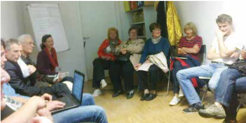
V Magdaleni se na področju oživitve degradiranega prostora - zapuščenega gradbišča, nekaj premika :)

Zbor smo končali v duhu spoznavanja z novimi udeleženci, ki so bili navdušeni nad našimi dejav-