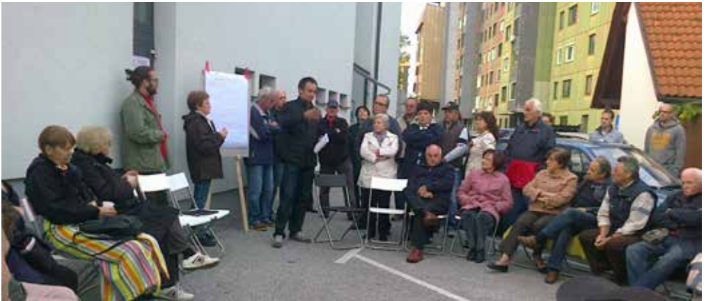
V Novi vasi se ne dajo zlahka. To so dokazali takoj na začetku, ko so zborovali pred zaklenjenimi vrati njihove mestne četrti (2013).

Na zboru sta bili prisotni tudi raziskovalki učenja skozi aktiviranje ljudi v svoji skupnosti, ki sta presenečeno sprejeli povabilo k sodelovanju pri prvi točki naslednjega zbora, ki smo jo naslovili Pogovor o skupnostnem izobraževanju in učenju skozi delovanje SČS Nova vas. 🌱