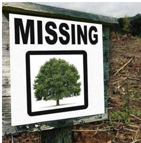
Za naše zelene koticke, ki delajo Maribor tako zelo privlačen, se ne bomo nehali boriti. Vsako drevo šteje. In mi smo jih prešteli.

vedno manj dreves, ker se odstranjena ne nadomeščajo, tista, ki še stojijo, pa so v vedno slabšem stanju. Udeleženci zborov SČS Tabor, Magdalena in Nova vas zato zahtevajo, da se v proračunu namensko zagotovi 200.000 evrov v 2016 in 2017 za načrtno izboljševanje stanja dreves v njihovih četrtih, da na Uradu za komunalno, promet in prostor izdelajo oceno potrebnih sredstev za redno vzdrževanje in zasaditve, ki bo osnova za zahtevana sredstva v proračunu in da odpadejo izgovori, da je denarja za investicije zmanjkalo.