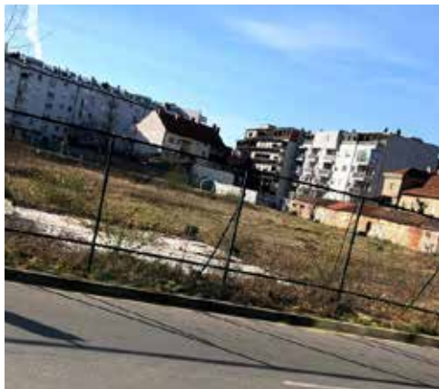
Glede parcele med Žitno, Jezdarsko, Betnavsko in Žolgerjevo ulico se nobenem od odgovornih še ni dalo odgovoriti

Zbor SČS Magdalena se je odločil, da ponovno pošlje poziva na MOM in MČ Magdalena glede kareja z zapuščenim gradbiščem med Žitno,