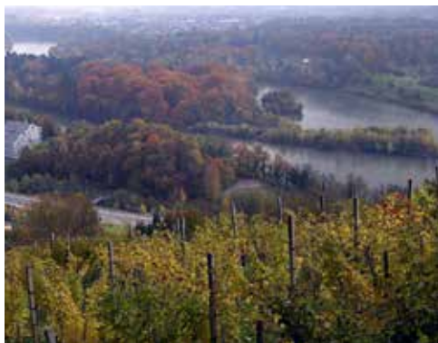
Vabljeni na Mariborski otok