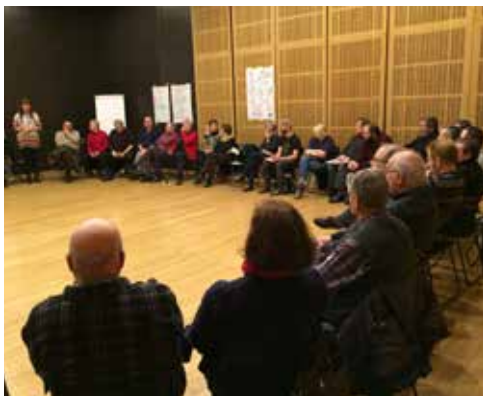
2. mestni zbor v Vetrinjskem dvoru

V uvodu v razpravo o prometu je mestna delovna skupina za promet nanizala problemske točke, ki jih sama zaznava pri svojem delu. Gre za javni prevoz, s katerim bi se za občanke in občane zmanjšala potreba po uporabi osebnih vozil nasploh, z uvedbo park&ride parkirnih območij, strateško lociranih ob mestnih vpadnicah pa bi se zmanjšal še avtomobilski promet, ki v mesto prihaja z oddaljenih lokacij. Navedeno spada v prometno strategijo, za katero se zdi, da je ni. Zakaj? Aktivnosti pristojnih na področju prometne politike, še toliko bolj pa na področju investicij in vzdrževanja prometne infrastrukture, se zdijo, kot da se oblikujejo iz danes na jutri, kar je pač moč zriniti v vsakokratni občinski proračun. Dela se izvajajo neoptimizirano, brez celostne obravnave vseh zaznanih potreb na določenem področju, ki bi jih lahko zadovoljili z enim obsežnejšim in kakovostnim posegom, namesto da se problematiko rešuje po delih večkrat in zato neprimerno dražje. Prav tako ni relevantnih informacij – morda je prav to ključni razlog – s strani odgovornih, kaj se počne, zakaj in kako se poseg vključuje v celostno strategijo. Nerazumevanje dela ljudi vedno bolj nejevoljne, vse skupaj pa potencira še vedno slabša kakovost izvedenih del, kjer svojo izvedbo nadzirajo izvajalci sami. Iz razprave smo lahko zaključili, da motorni promet s svojimi negativnimi varnostnimi in okoljskimi vplivi bremeni vsakega izmed nas, po dru-