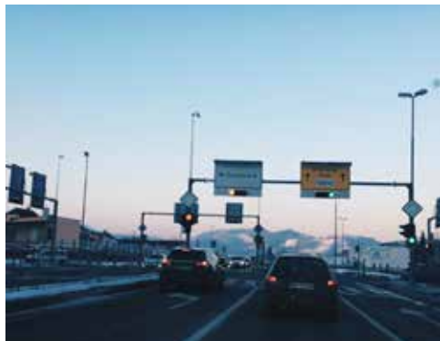
Smer - Studenci

Na začetku tokratnega zбора SČS Pobrežje so se pregledali sklepi drugega mestnega zboru. Ugotovilo se je, da je bilo veliko časa posvečenega prometu, ki se vedno bolj kaže kot zelo pereč problem našega mesta. Udeleženci_ke so se ob novici, da je bil ravnokar iz vinjetnega sistema izvzet tunel Markovec, strinjali_e, da bi si bilo bolj smiselno pri zahtevah SČS Pobrežje za izzjemno hitre ceste iz vinjetnega sistema prizadevati za uveljavitev lastne pravice ter se manj sklicevati na primer Kopa in Ljubljane. Izpostavljena je bila tudi problematika velikih mestnih avtobusov, ki ponekod zaradi ozkih ulic in ostrih ovinkov le-te komaj zvoziyo. Avtobusi