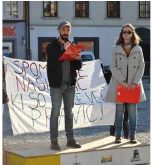
»Spomnimo se naših bic« na Glavnem trgu

V Kolektivu Pizda! smo prepričani_e, da stojimo na pomembni prelomnici. Temeljne delavske, ekonomske in socialne pravice, ki so bile izbrjane v dolgem in trdem boju, se ponovno krčijo in grozi nam, da bodo počasi izničene,