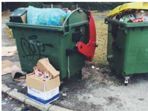
Stanje ekoloških otokov v Kamnici