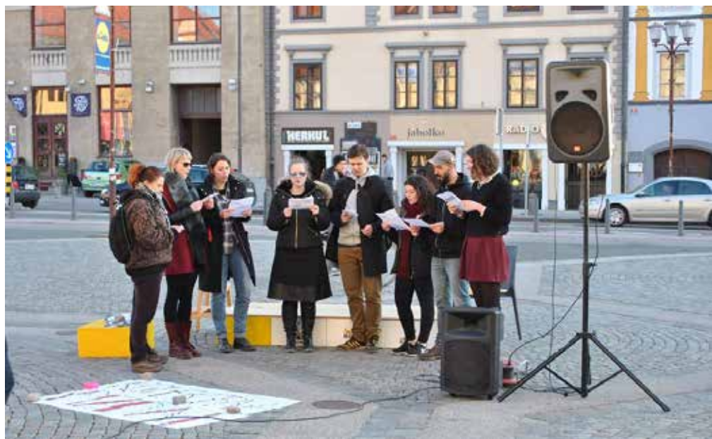
Alternativni pevski zborček

• Shod, na katerem je alternativni zborček zapel pesmi Bella Ciao, Jutri gremo v napad in • Žensko himno, smo zaključili_e v borbenem • in optimističnem duhu. Organiziranje takšnih • dogodkov je izjemnega pomena, vendar jim • mora po zaključku slediti aktivno delovanje in • udejstvovanje. Za enakopravnost in pravice se • moramo boriti vseskozi. Vsak dan! Nihče nam • jih ne bo podaril. Boljše družbe namreč ni mo- • goče izbojevati, če ne vzplamti iskra boja naj- • širših ljudskih množic.