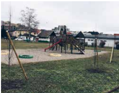
Novo zasajena drevesa v Novi vasi

Na tokratnem zboru v Novi vasi so udeleženci_ke ponovno govorili_e o kar nekaj temah. Kot prva točka dnevnega reda je bila v obravnavi dobra vest z Obale, kjer za vožnjo skozi predor Markovec ne bo več potrebna vinjeta in bo za lokalni promet lažje skombinirati svojo vozno traso brez skrbi. Že kar nekaj časa Pobrežani_ke, s podporo vseh ostalih zborov, opozarjajo