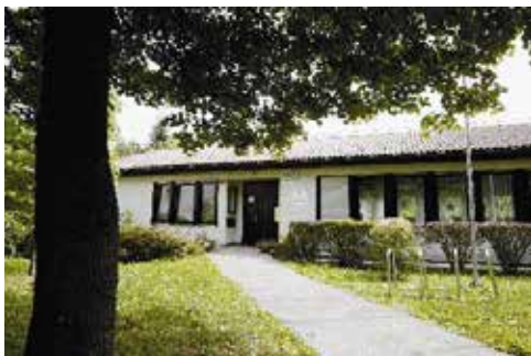
Zgradba MČ Koroška vrata, ki ji grozi rušitev