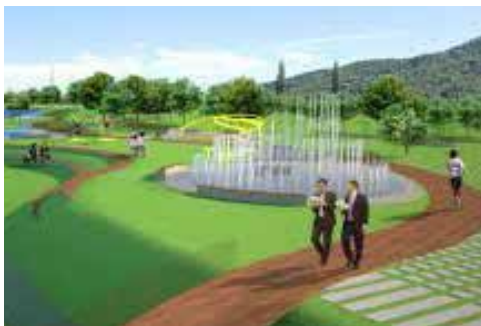
Vizualizacija načrtovanega parka ob Pekrskem potoku

Trajnostna urbana strategija je sprejeta, zajema