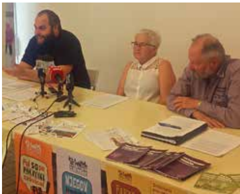
Tiskovna konferenca, 25. 5. 2017