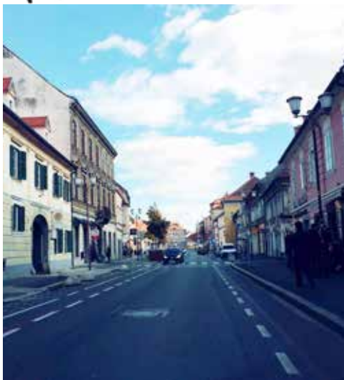
Še vedno eksperimentalna ureditev Koroške ceste

park in tri ribnike, poročala, da so v skupini že večkrat opozorili občino, da je treba več dreves ob cesti pri treh ribnikih porezati. Drevesa so že močno nagnjena na cesto in grozi, da se bodo vsak čas podrla. Občina zaenkrat še nima posluha za reševanje tega problema. Delovna skupina je prav tako ponovno začela s peticijo, saj so na občini ponovno dali prazne obljube o obnovi razsvetljave ob 1. in 2. ribniku.