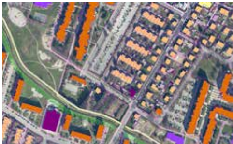
Predvideno območje parka ob Pekrskem potoku

Če so imele_i Novovaščanke_i že grenak okus zaradi dogajanja s parkom ob Pekrskem potoku, saj se nekaj časa ni dogajalo nič, so po poročanju članov DS ponovno dobile_i občutek, da to končno utegne biti primer zelo dobrega sodelovanja med tistimi, ki projekte izvajajo, in tistimi, ki na nekem območju živijo in ga najboljše poznajo. Kot sta po-