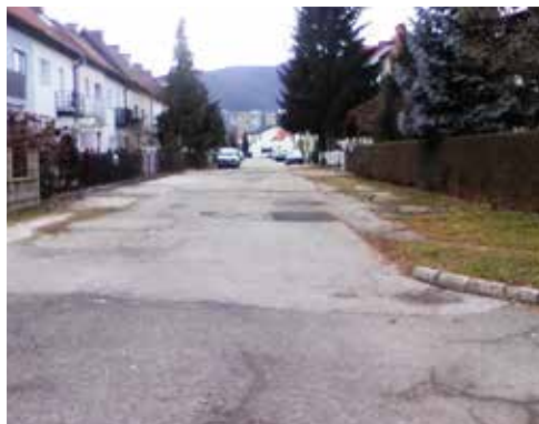
Pri obnovi Koseskega ulice stanovalci nočejo le delne rešitve