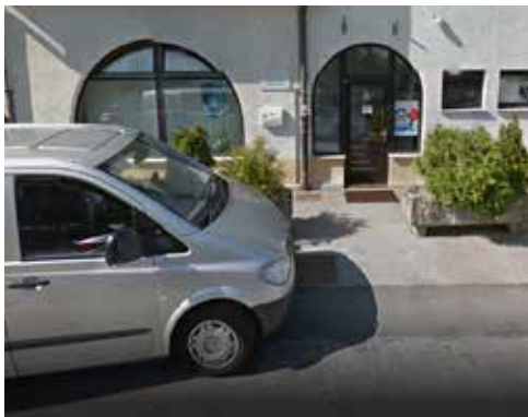
Trenutni nezadostni prostori za potrebe krajanov