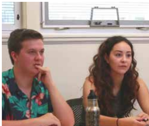
Učenci predstavljajo svoje projektne ideje za PP

Skraini čas je že, da začnemo upoštevati mladino! Njihovi predlogi za gospodarsko, infrastrukturno in družbeno izboljšanje so v kompleksnosti in relevantnosti primerljivi »odraslim«, če ne celo boljši.